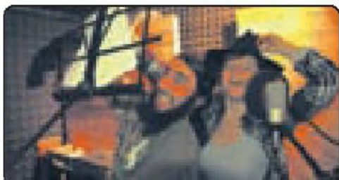
Eden od bombončkov je zasedba Bakalina in njihova pesem Banda krawatarska.